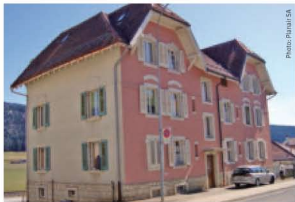
Le bâtiment avant la rénovation.

Situé à La Sagne, en bordure de la route qui mène aux Ponts-de-Martel, (NE), ce petit immeuble de 6 appartements construit en 1912 n'avait jamais auparavant été assaini complètement. Son propriétaire, Pierre Renaud, également directeur du bureau Planair SA, a décidé d'effectuer tous les travaux en vue d'une certification au standard Minergie.