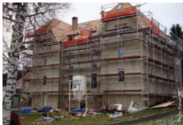
Les travaux d'assainissement en cours.

Toutes les façades ont été assainies depuis l'extérieur avec une augmentation de l'enveloppe de 25 cm. Les balcons existants étaient pris dans la dalle et constituaient un pont thermique. Ils ont été démontés pour être remplacés par des balcons métalliques, appuyés sur des piliers extérieurs, permettant de supprimer le pont thermique.