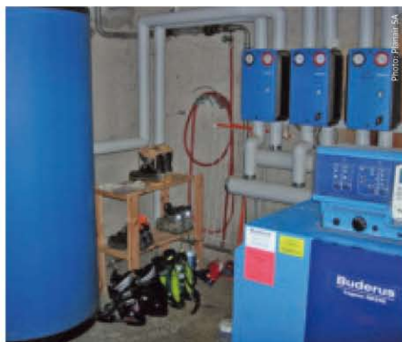
L'installation existante de chauffage au mazout.

Isolation du plafond des caves (locaux non chauffés) de 10 centimètres en moyenne.